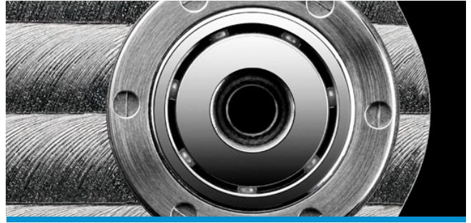
Roulement SM 1234XZRY compatible avec le calibre ETA 7750 Bearing SM 1234XZRY compatible with ETA 7750 calibre

Le roulement de la ligne Prodige est totalement interchangeable avec ceux du fabricant de mouvement. Un écrou assure la fixation de la masse oscillante sur le roulement: une solution originale et fiable. L'outillage de montage avec réglage du couple de serrage intégré assure un montage aisé et sûr sans risque de détériorer la surface décorée de la planche de masse.